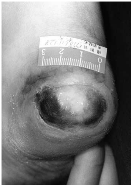
Fig. 6 Photography of right calcaneal ulcer after three months

患者では波形が正常者と異なるが上昇，下降は同様であった．この違いは患者に糖尿病があり，動脈の硬さが影響しているのではないかと考えられた．lipoPGE 1 を1ヵ月投与後，安静時疼痛はやや改善があり中止して様子を見ていたが，再び安静時疼痛が悪化したため再度2週間投与した．ABIは施行前0.28から3ヵ月後0.34とやや改善，tcPO 2 は31 mmHgから31 mmHgと変化なく，T1/2は270秒から230秒と短縮し，やや改善がみられた．安静時疼痛は4から3とやや改善した．しかしながら潰瘍は3×2cmと改善がみられなかった（Fig. 6）．なお患者の印象として施行している間は足の痛みもなく気持ちが良かったと述べてい