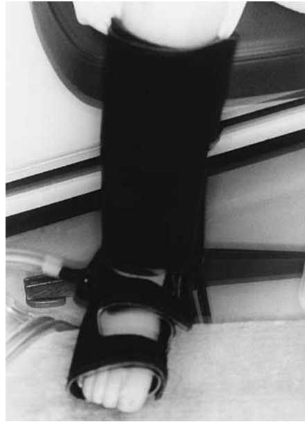
Fig. 3 ArtAssist®