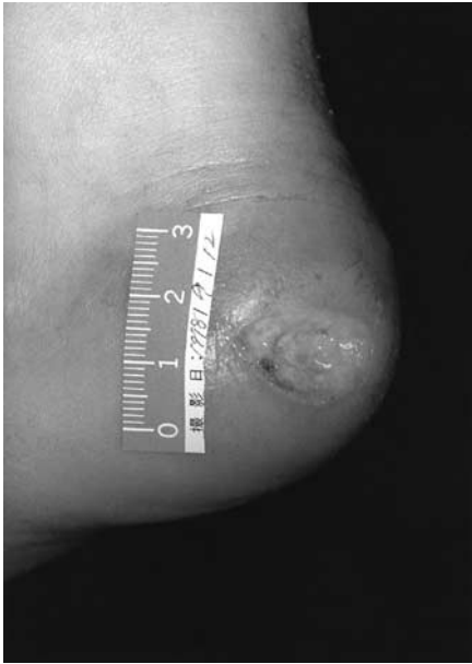
Fig. 1 Photograph of right calcaneal ulcer on admission