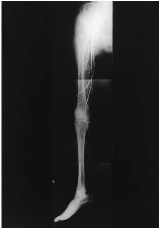
Fig. 2 Arteriography

mmHgで3秒間inflateし、その後deflateし、1分間3 cycle施行するように作成されている (Fig. 3).