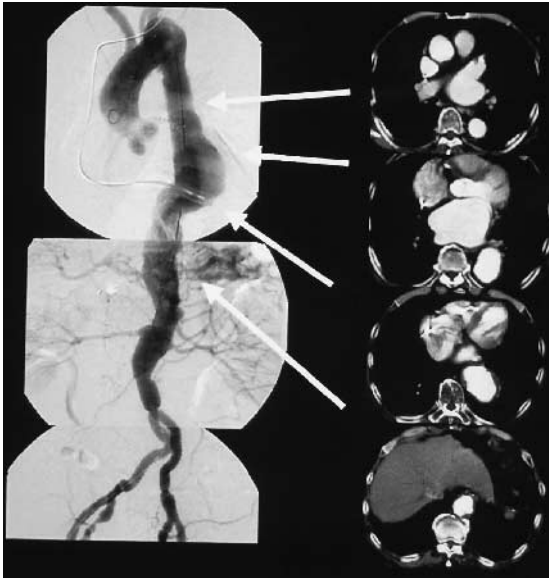
Fig. 1 Preoperative digital subtraction angiography (DSA) and contrast-enhanced computed tomography (CECT)