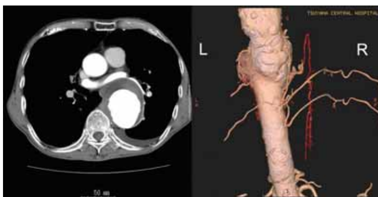
Fig. 1 Preoperative computed tomography (CT).

Right side is an image of the three-dimensional CT at the view from slightly left behind. Adamkiewicz artery arising from a left T9 intercostal artery is highlighted in red. T9 intercostal artery is connected with a small artery which arises directly from the descending aorta.